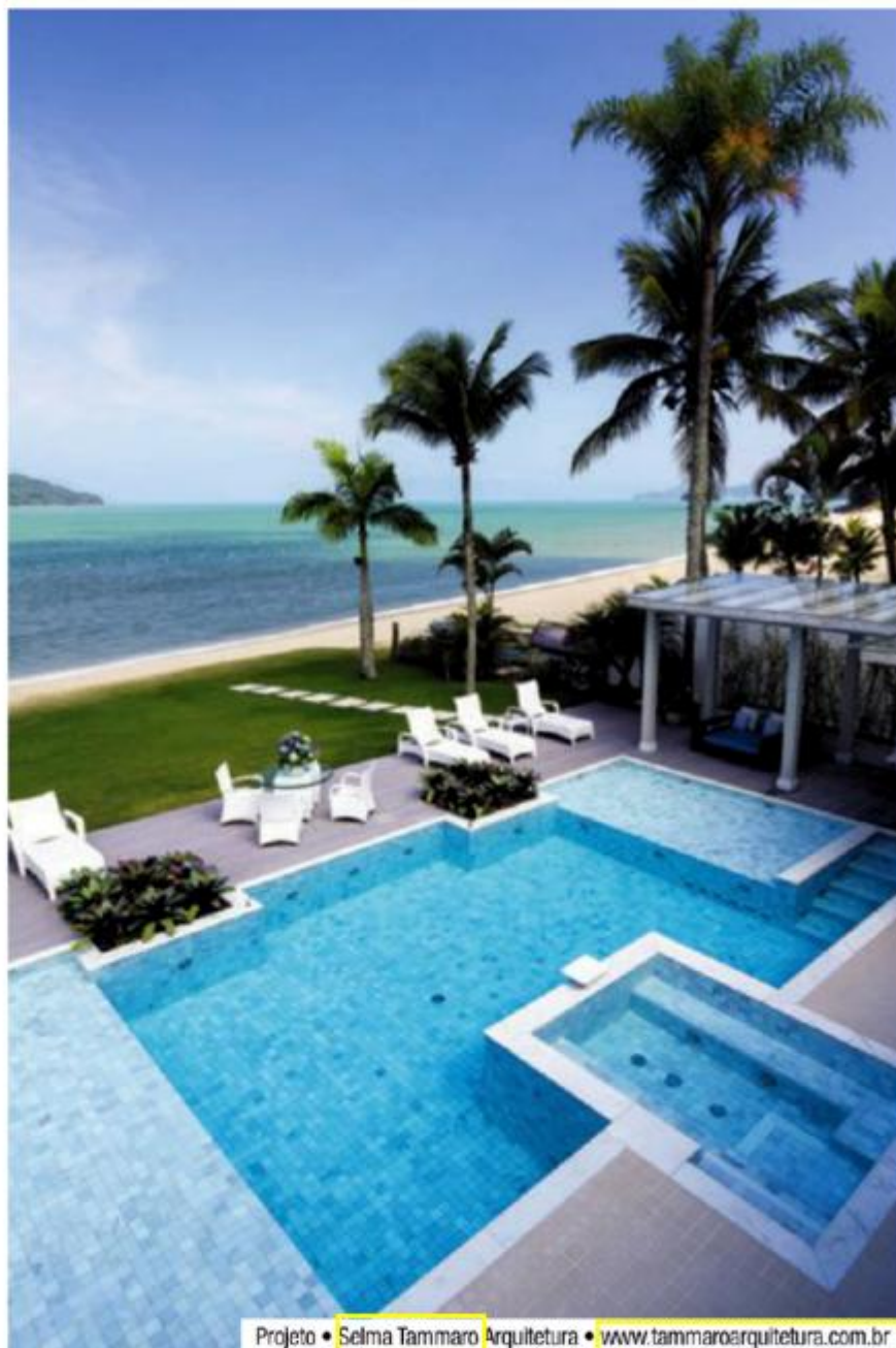
Projeto • Selma Tammaro Arquitetura • www.tammaroarquitetura.com.br