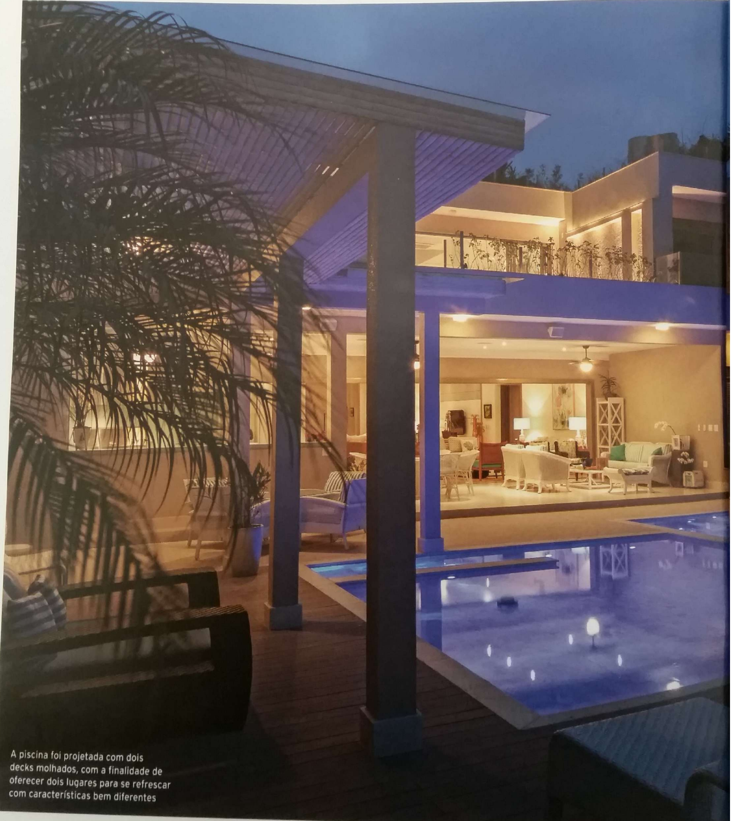
A piscina foi projetada com dois decks molhados, com a finalidade de oferecer dois lugares para se refrescar com características bem diferentes

A piscina com spa com hidromassagem e prainhas com função deck molhado é a grande vedete desta casa no litoral de São Paulo