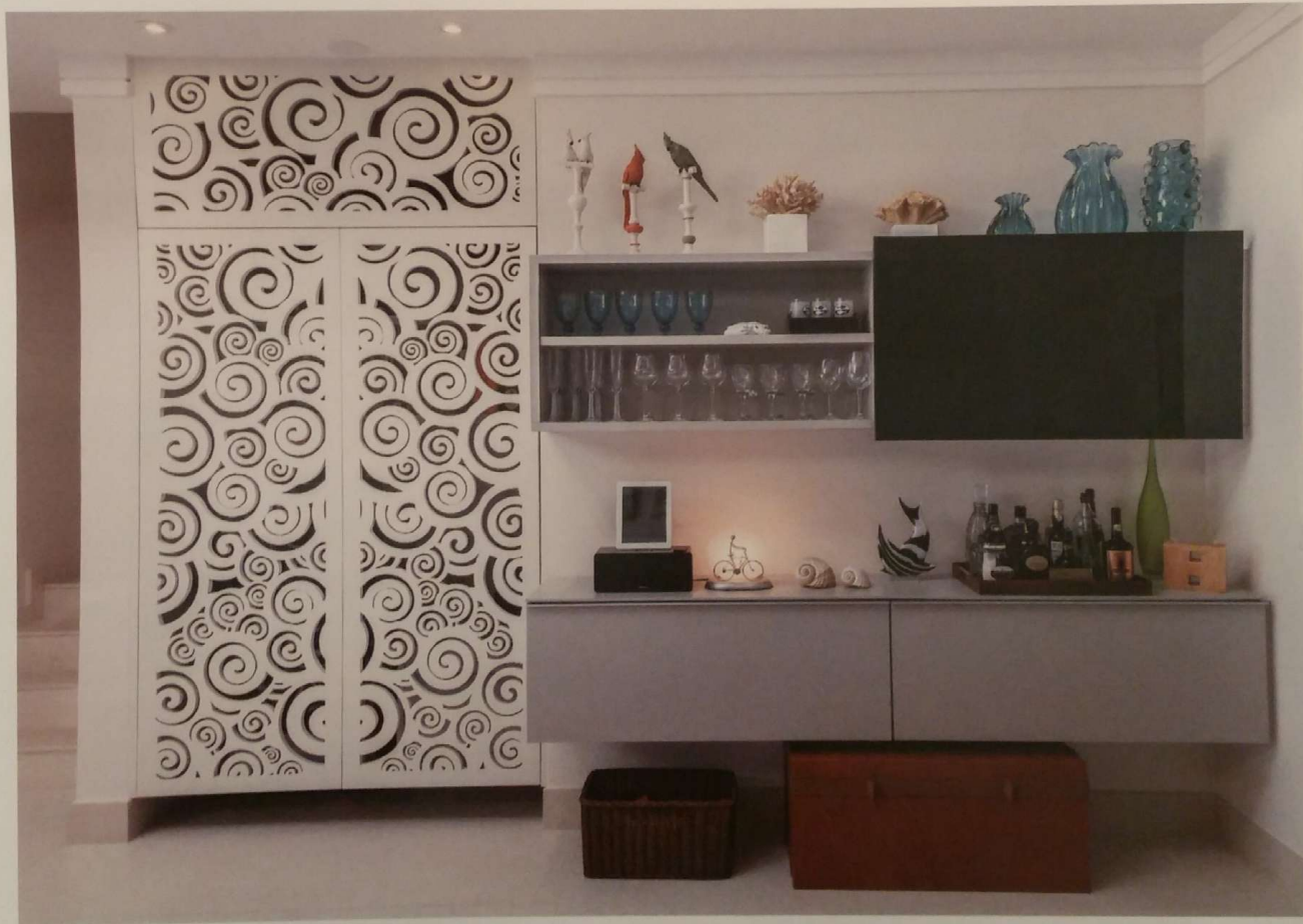
Pé direito alto e ampla vista do mar caracterizam o ambiente